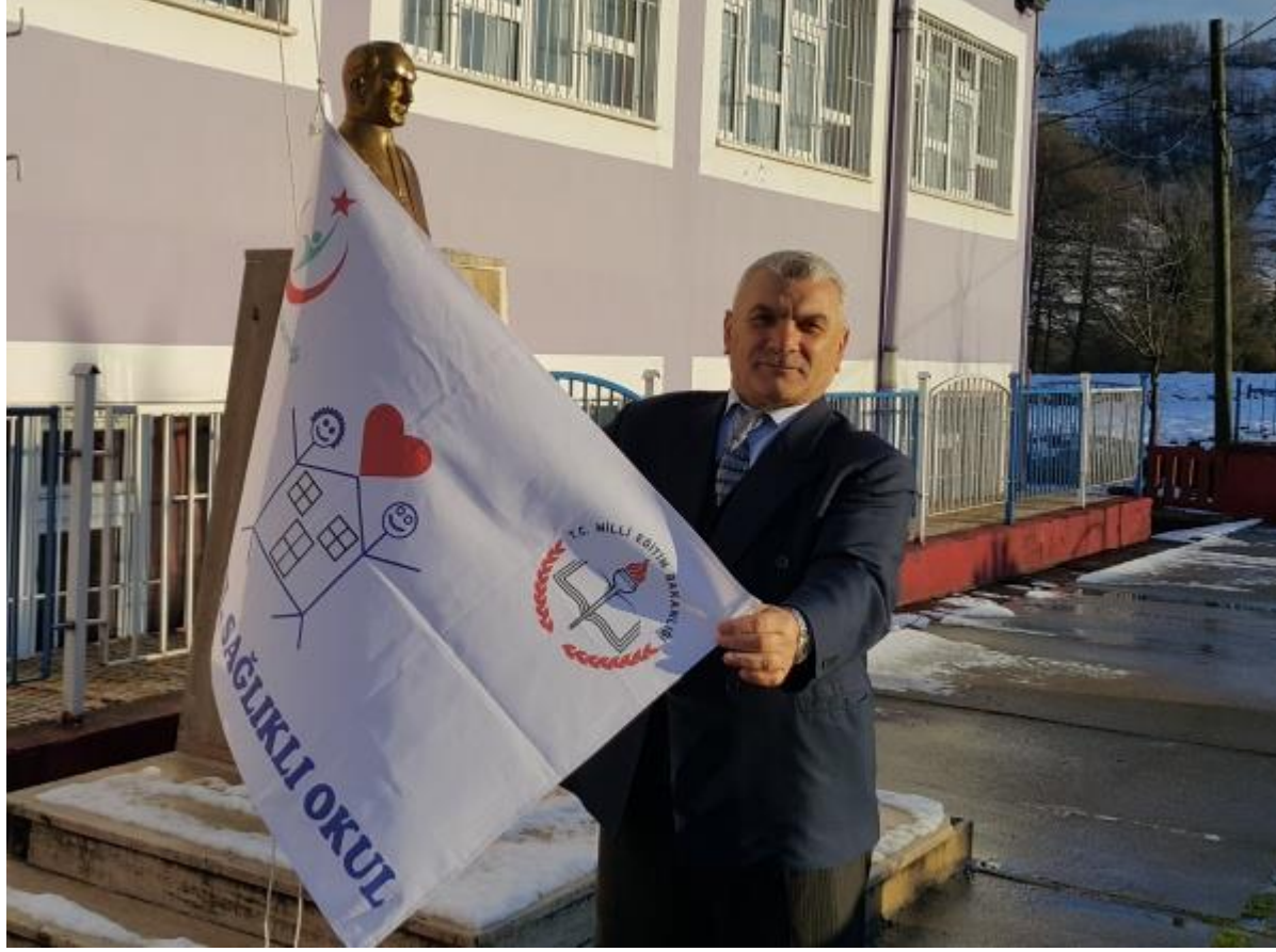
PINARALTI İLKOKULU/ ORTAOKULU